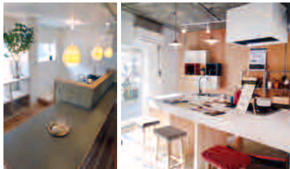
リノベーションを行った住戸(鶴甲団地)

団地内の既存住宅の流通促進や若年世帯の団地への流入を通して、地域を活性化させることをめざし、平成 26 年度から鶴甲団地で取り組みを行いました。平成 28～29 年度にかけては、神戸市と連携して高倉台団地でリノベーションモデルルームの整備・公開、イベント「団地カエル in 高倉台」などによる住情報の発信等といった取り組みを予定しています。