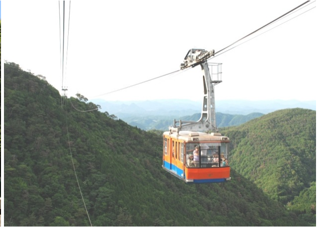
六甲有馬ロープウェー