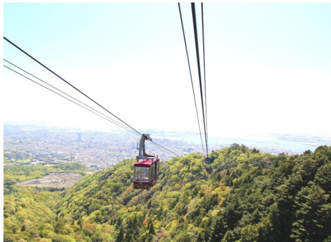
摩耶ロープウェー