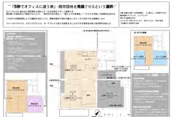
選ばれた最優秀プラン