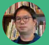
フログハウス (団地)